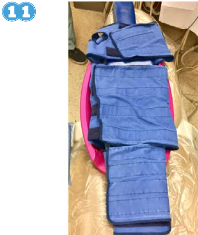
11 Mi dentista posiblemente tenga que usar una cobija especial para que no me caiga de la silla.