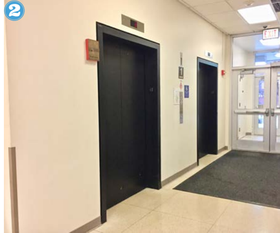
2 Mi familia y yo nos subimos al elevador.