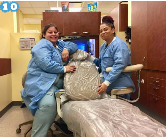
10 Mi dentista me pide que me siente en una de las sillas grandes.