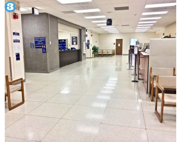
3 La clínica dental es grande.