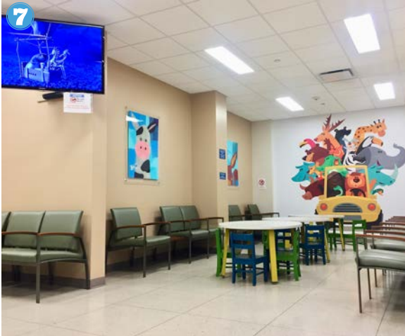
7 Espero callado en la sala de espera.