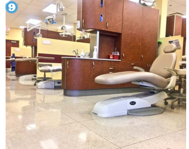
9 Camino junto sillas grandes. Uno de mis padres viene conmigo.