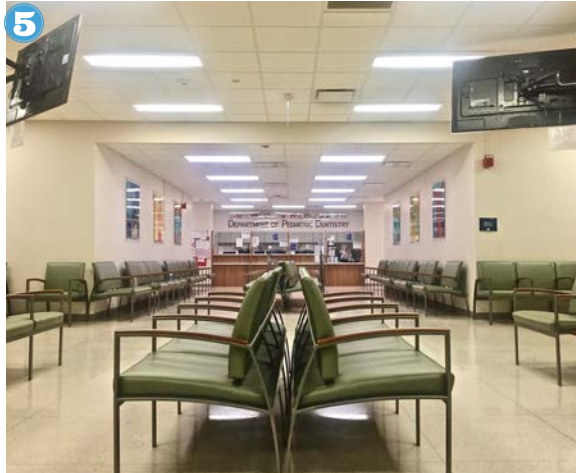
5 Camino por la sala de espera para llegar al escritorio de enfrente.