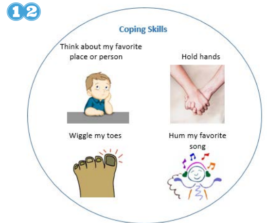
12 Yo puedo hacer cosas para hacerme sentir mejor si me da miedo.