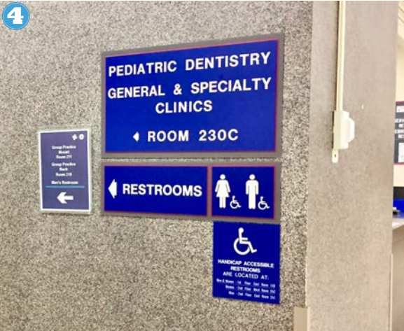
4 Tengo que buscar los letreros para encontrar mi dentista.