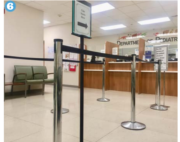
6 Me registro con la recepcionista.