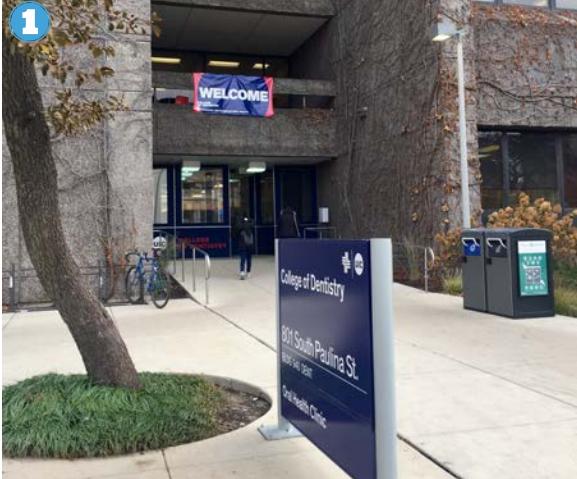
1 Hoy voy a ir al dentista. El dentista ayuda a mis dientes que se miran y sientan bien.

Detalles: Esta historia puede ayudarte imaginar cómo será tu visita al dentista. (Esta historia fue creada para el uso de niños con autismo, pero puede ser útil para todos los niños.)